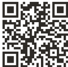
A Zepp alkalmazás letöltése